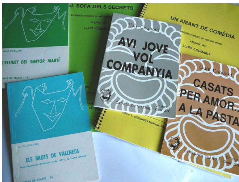
Algunes portades d'obres de l'autor.

DATA DE CREACIÓ DEL DOCUMENT (DATA DEL CÒMPUT): 29/07/2009