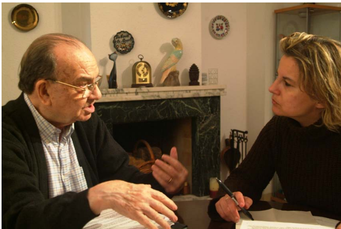
Coquard comentant aspectes de la seva biografia i mostrant el seu arxiu personal, el dia 11 de febrer del 2009.