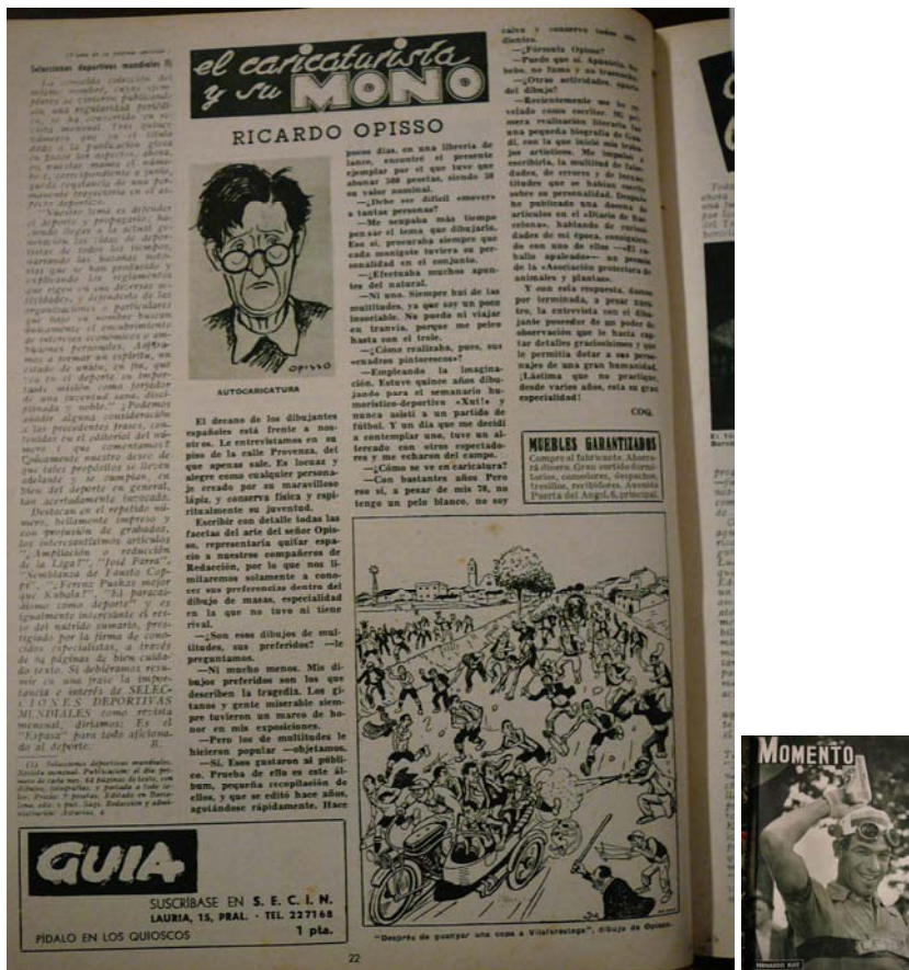
Any 1952: Secció de Coquard a la revista Momento (exemplar del 10 de juliol del 1952: any 2, núm. 69; pàg. 22).