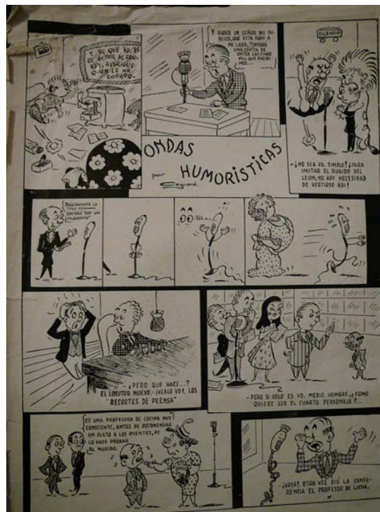
Anys 1950: Text i dibuixos de Lluís Coquard a la Revista Crítica .