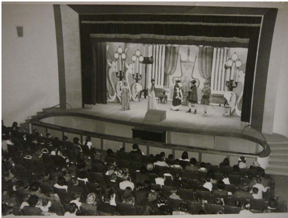
Any 1966: Moment de la representació de Rosabel, la bella durmiente (en català s'havia estrenat com a La bella adormida del bosc ), al Teatre Peques de Barcelona, per la companyia La Rondalla, amb direcció de Paco Periu. Foto: M. Josep R. Lucas (gentilesa Arxiu Lluís Coquard).