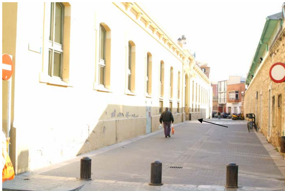
Vista des de c/ d'Olesa de Bonesvalls