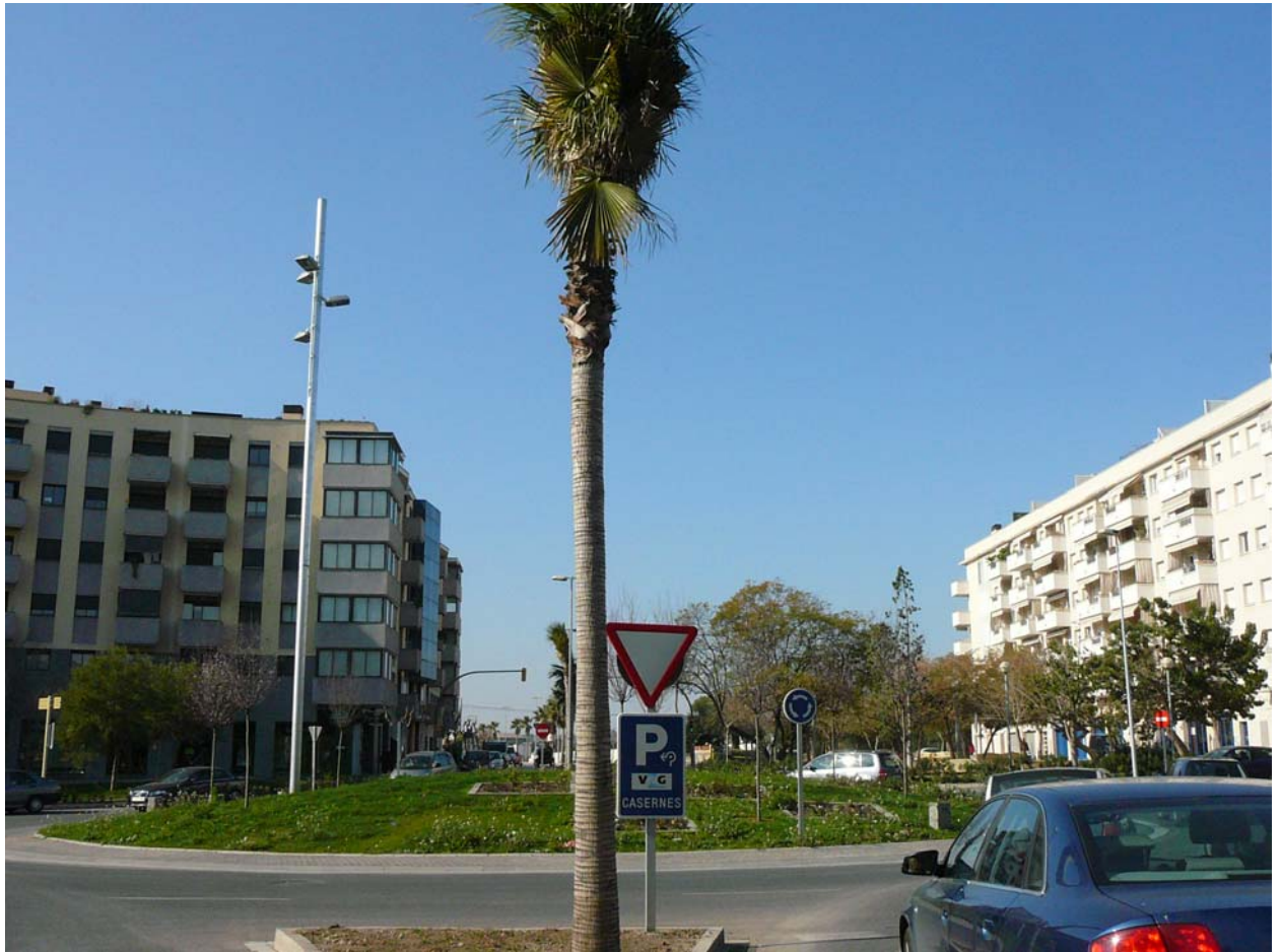
Plaça de la Moixiganga. Indica pàrquing proper CASERNES.