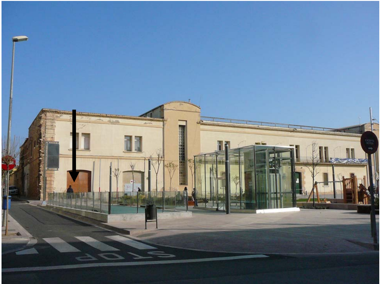
Plaça de les Casernes. Entrada al pàrquing per l'esquerra del conductor.