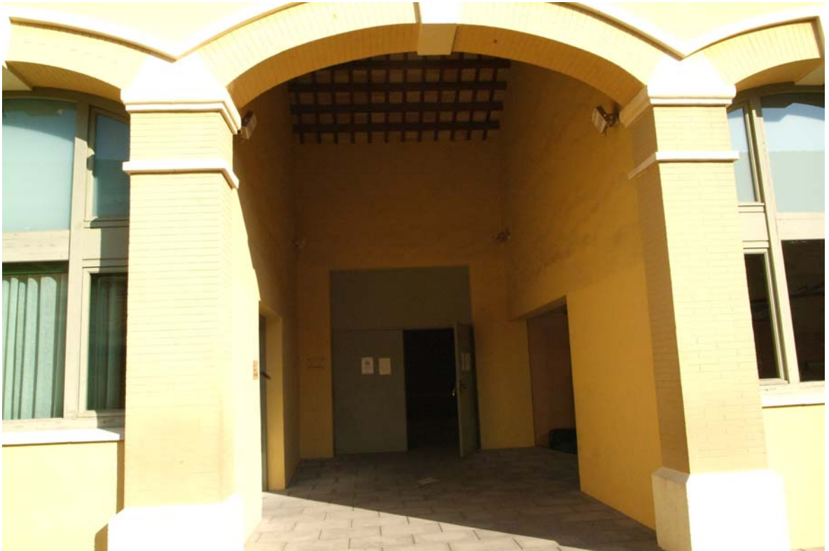
Accès a la sala polivalent