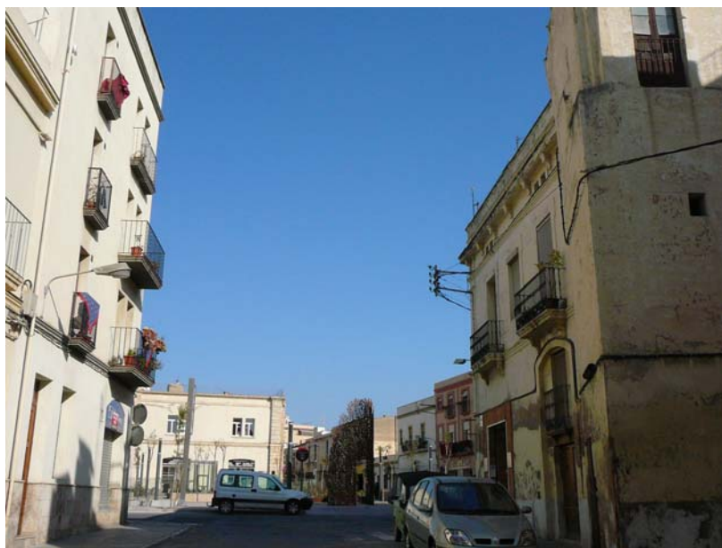
La plaça Llarga enllaça amb la Plaça de les Casernes.