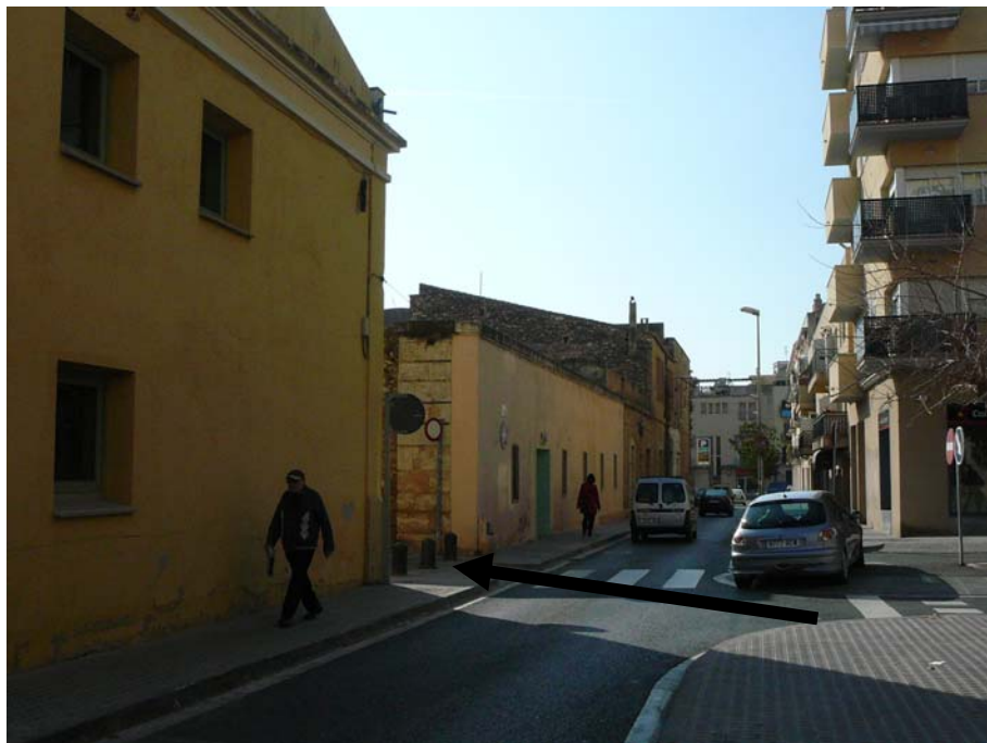
El carrer de l'Escorxador queda a mà esquerra (indicat a la foto), inaccessible per al cotxe, si venim en cotxe per c/ d'Olesa de Bonesvalls. Si seguim recte, arribem a la plaça de les Casernes, on hi trobem l'entrada a un pàrquing.