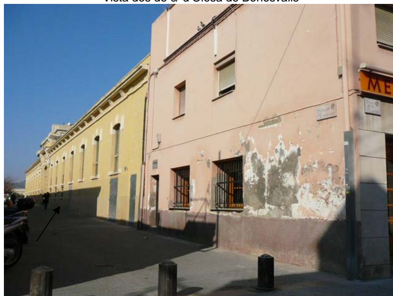
Vista des de c/ de les Casernes