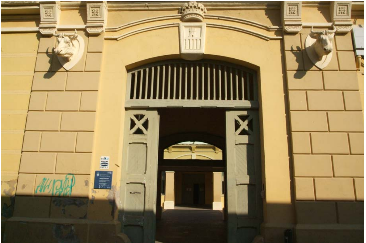
Porta general del recinte.

b) Pati central del recinte, on hi ha l'accés a la Sala polivalent