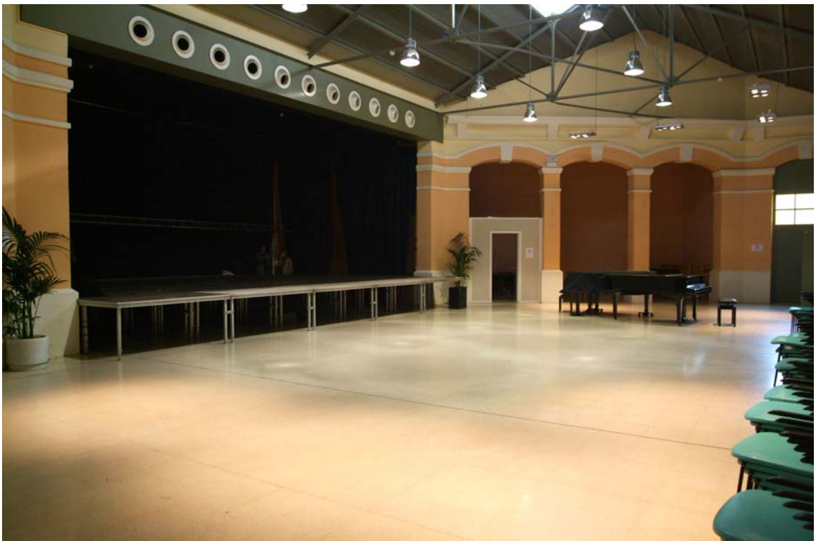
c) Interior de la Sala polivalent o « Zona XXI »